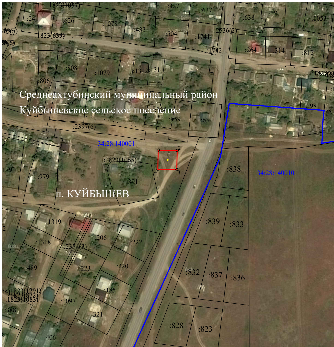
Схема расположения границ публичного сервитута для размещения объекта "ТП № 420", расположенного по адресу: Волгоградская область, Среднеахтубинский район

Используемые условные знаки и обозначения: