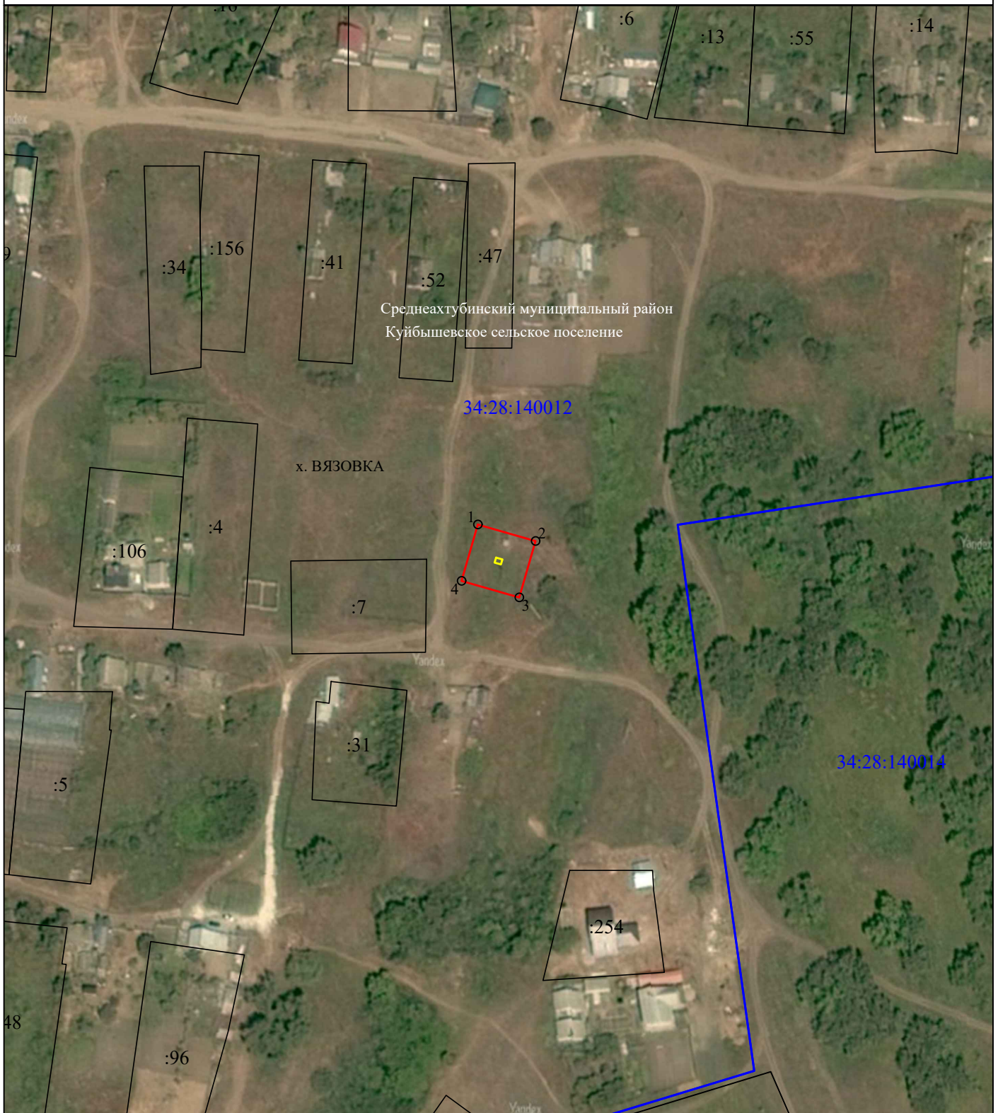
Схема расположения границ публичного сервитута для размещения объекта "ТП № 381", расположенного по адресу: Волгоградская область, Среднеахтубинский район