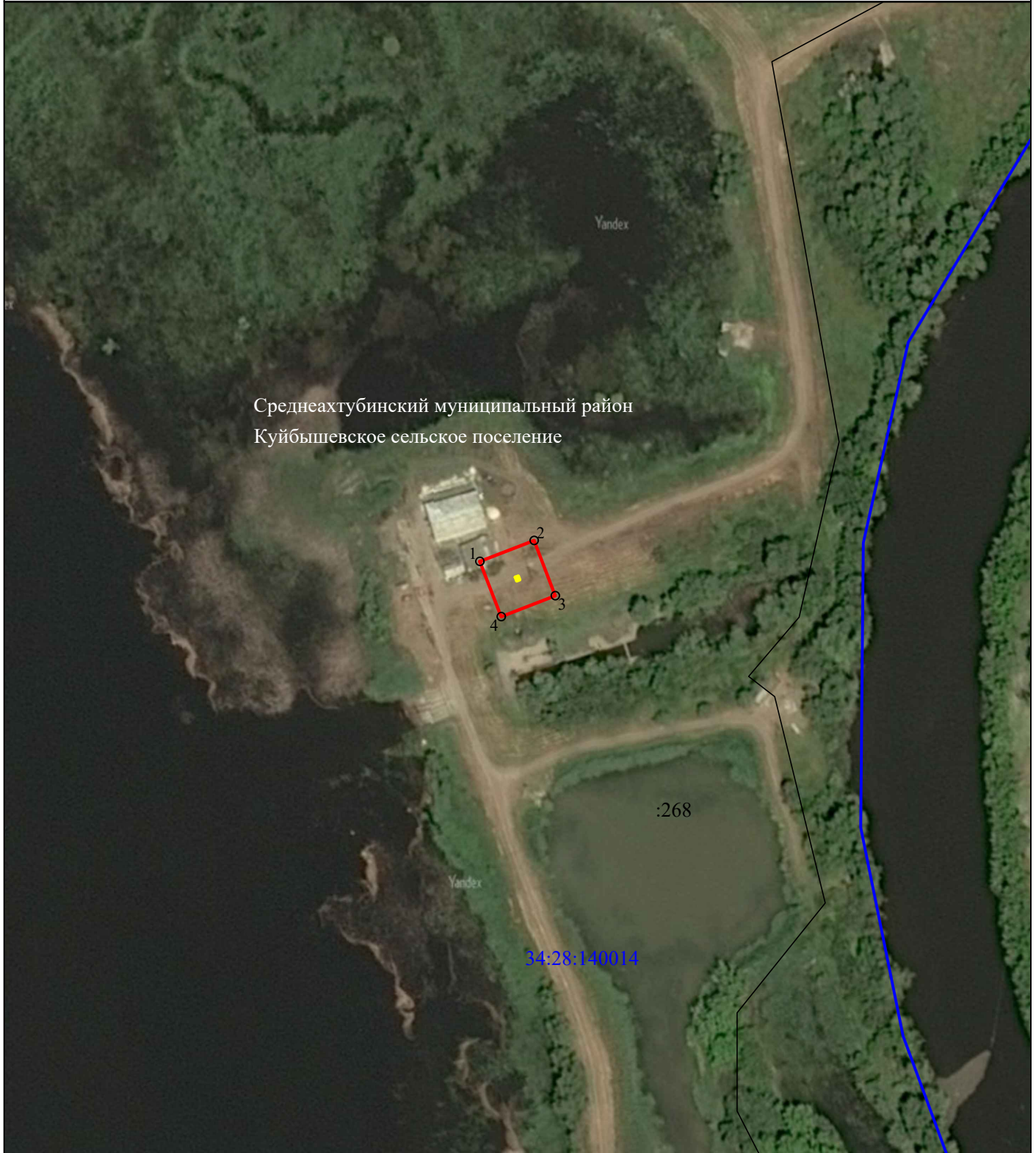
Схема расположения границ публичного сервитута для размещения объекта "ТП № 289", расположенного по адресу: Волгоградская область, Среднеахтубинский район

Используемые условные знаки и обозначения: