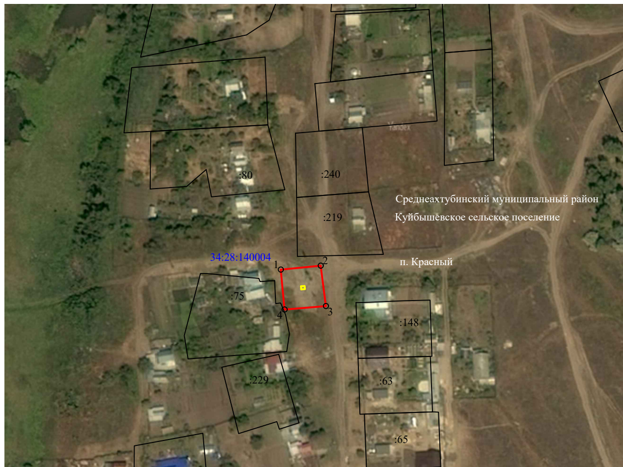
Схема расположения границ публичного сервитута для размещения объекта "ТП № 111", расположенного по адресу: Волгоградская область, Среднеахтубинский район